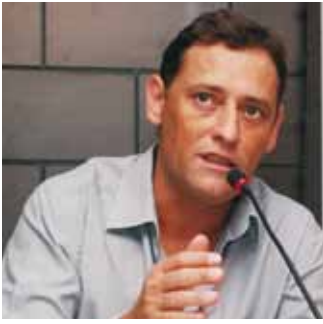
Artur Henrique Presidente da CUT Nacional