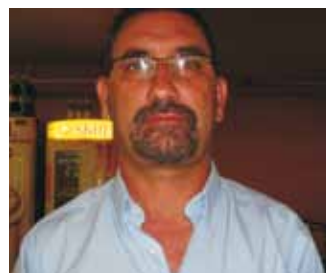
Oton Diretor do SINDSEP-DF