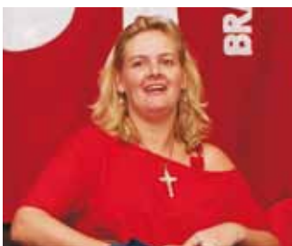
Tuty Presidenta da CONTRAC'S