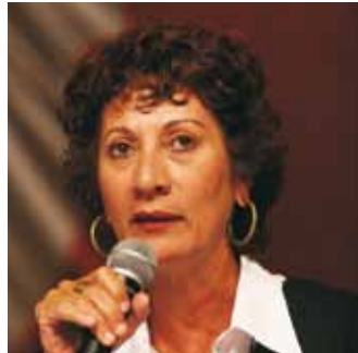
Rejane Pitanga Presidenta da CUT DF